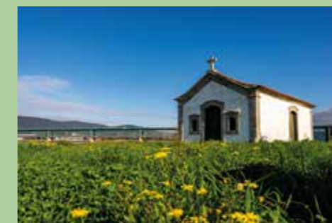
18 Capela de S. Lourenço 41,69036° N, 8,81851° O