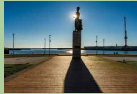
1 Estatua à mulher Vianesa 41,68800° N, 8,83892° O

O presente itinerário fotográfico identifica locais emblemáticos localizados nas margens do rio Lima.