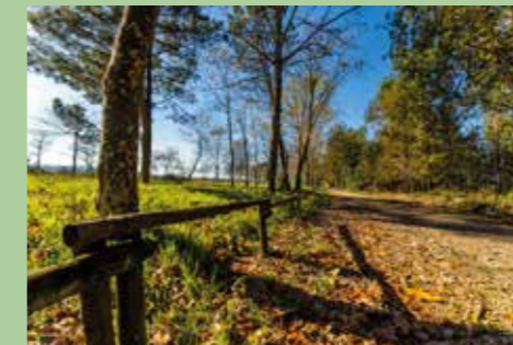
10 Marginal rio Lima 41,70573° N, 8,72756° O