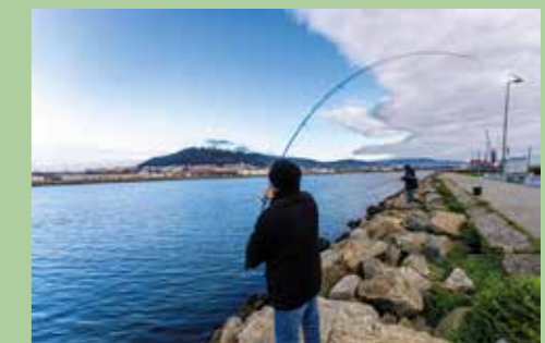
19 Foz do Lima 41,68421° N, 8,83316° O