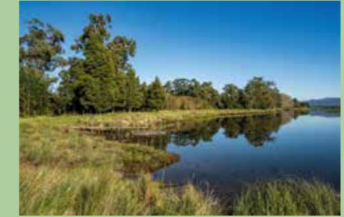
7 Embarcadouro de Tira Vau 41,69778° N, 8,76838° O