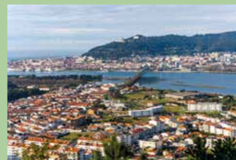
17 Monte Galeão 41,67774° N, 8,79537° O