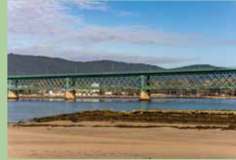
5 Ponte Eiffel 41,69413° N, 8,82009° O