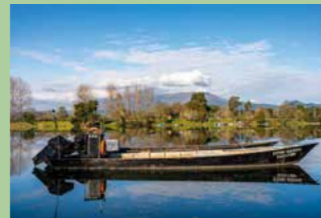
13 Moreira de Geraz do Lima 41,72517° N, 8,67549° O