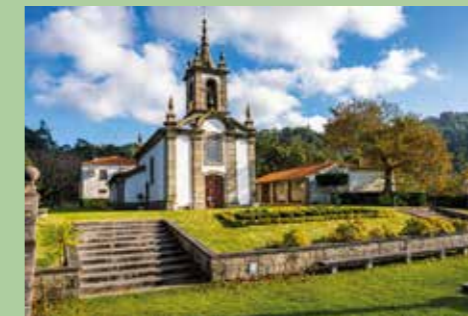
14 Monte Senhora do Crasto 41,68721° N, 8,69434° O