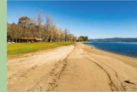
6 Parque da Cidade 41,69585° N, 8,81681° O