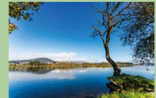
15 Veiga de São Simão 41,69226° N, 8,77307° O