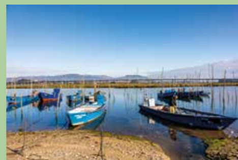
16 Cais - Avenida Gustave Eiffel 41,68864° N, 8,79215° O