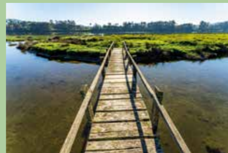
8 Praia da Preguiça 41,69854° N, 8,76401° O