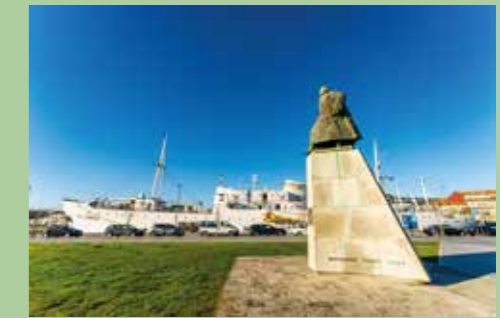
3 Doca comercial 41,68986° N, 8,83058° O