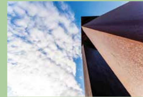
2 Praça da Liberdade 41,69072° N, 8,82763° O