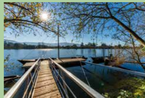
12 Cais de Lanheses 41,72727° N, 8,67582° O