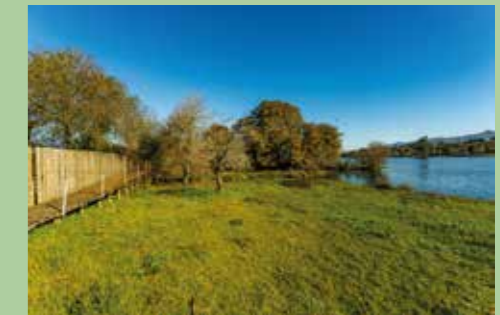
11 São Salvador da Torre 41,71166° N, 8,71507° O