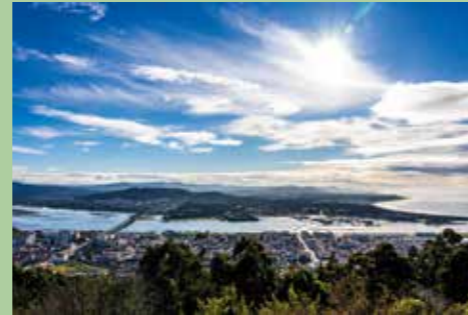
4 Monte Santa Luzia 41,70134° N, 8,83492° O